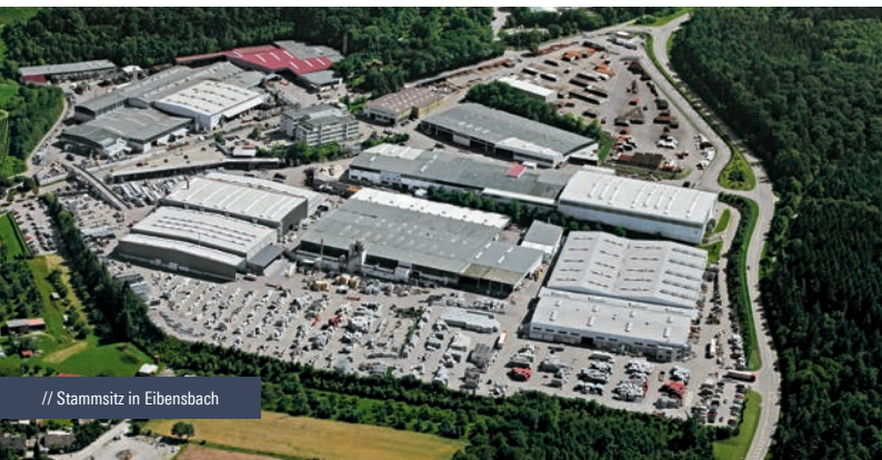
// Stammsitz in Eibensbach