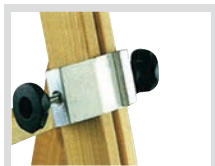
Klemmfix für Holz-Holzverlängerung 1016.253