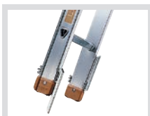
TOPIC Stahlspitzen 1023.001