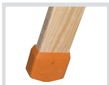
Leiterschuh für Holzleiter 1016.052