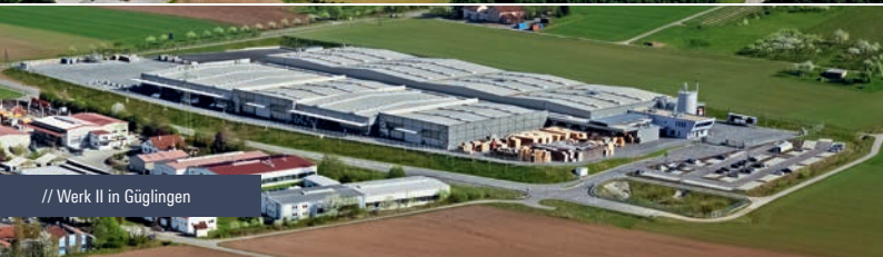
// Werk II in Güglingen

Weitere Informationen zu Layher Leitern und Treppen erhalten Sie bei: