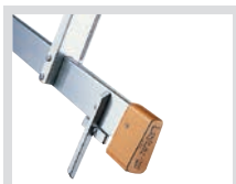
Fußspitzen für Traverse 1016.013