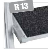
Korundbeschichtung R 13 auf Anfrage

Passendes Zubehör finden Sie auf Seite 132 - 133.