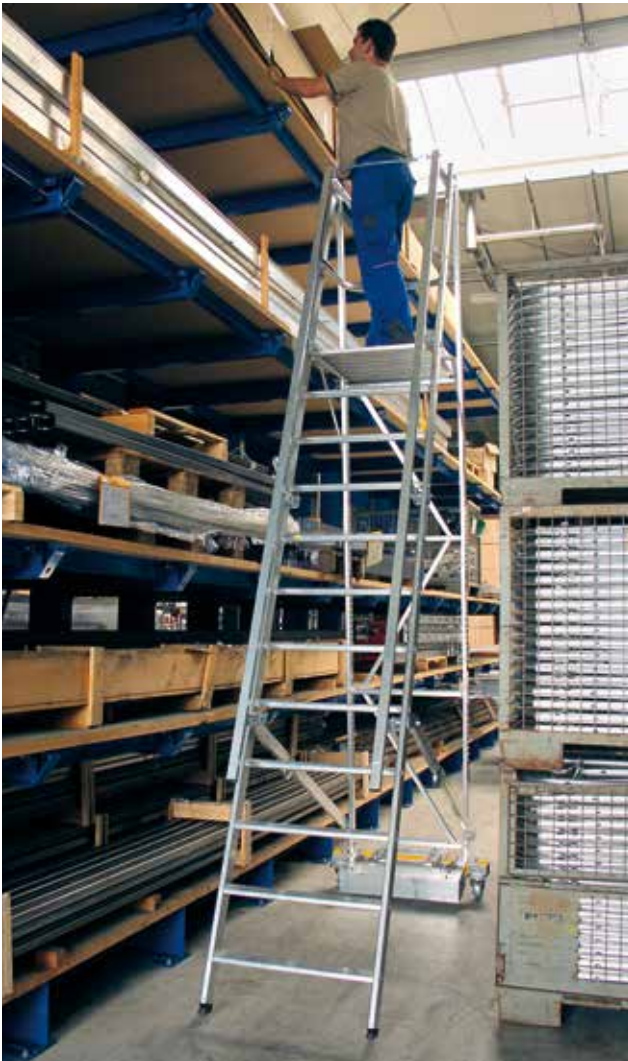
Abb. Bestell-Nr. 52712