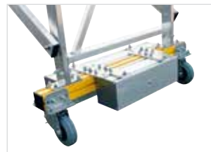
Abb. Ballastgewicht 80 kg