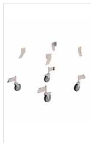
Abb. Bestell-Nr. 50120