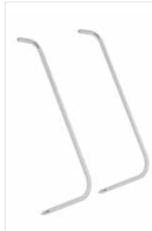
Abb. Bestell-Nr. 50209