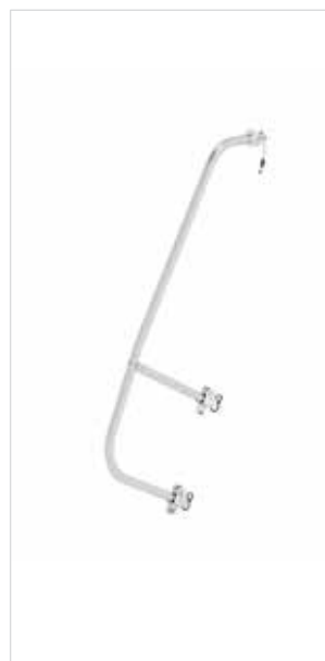
Abb. Bestell-Nr. 50234