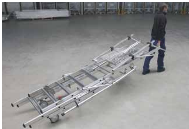
Einfacher Transport durch Rollen Ø 150mm