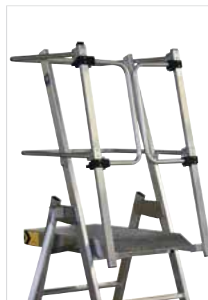
Rundum geschützt durch stabiles Geländer und Knieleiste