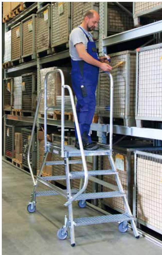
Abb. Bestell-Nr. 51204 mit Handlauf Bestell-Nr. 50209

Passendes Zubehör finden Sie auf Seite 132 - 133.