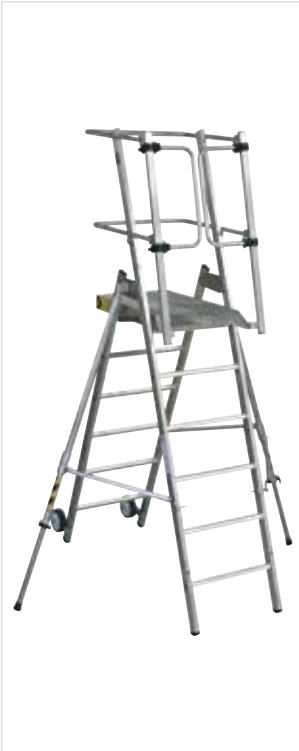
Standardversion FlexxStep, Bestell-Nr. 52526