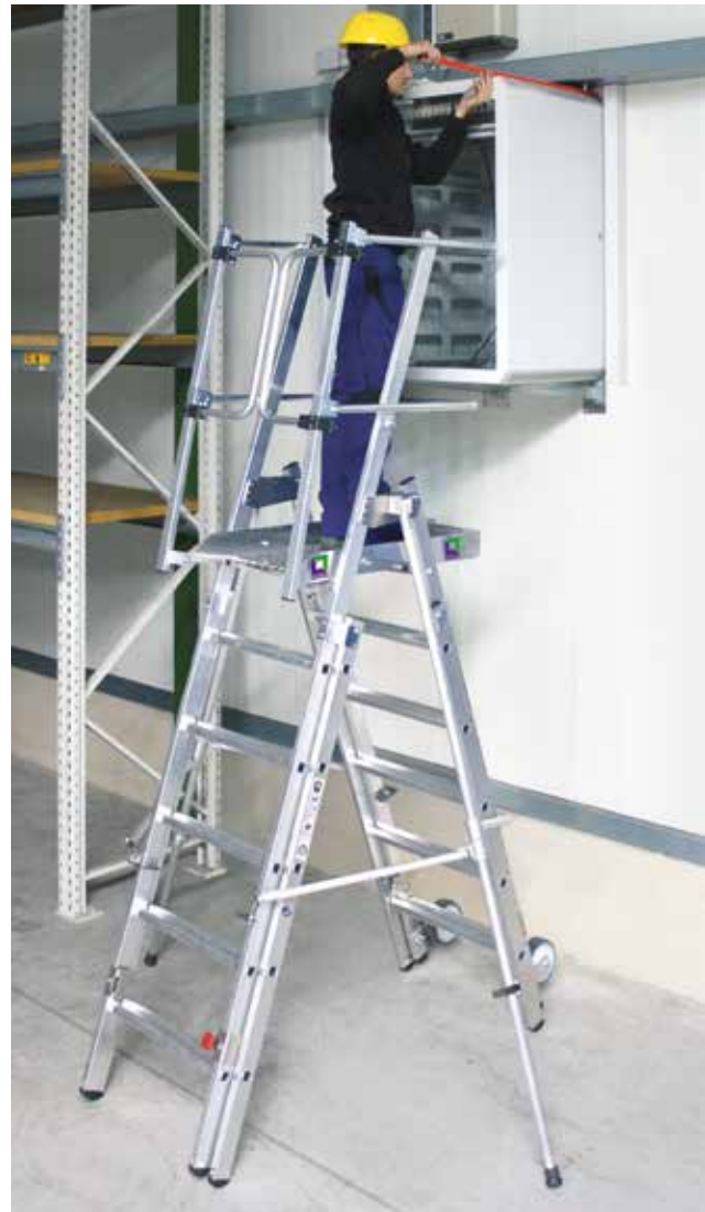
Abb. Bestell-Nr. 52526