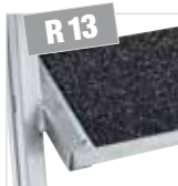
Korundbeschichtung R13 auf Anfrage