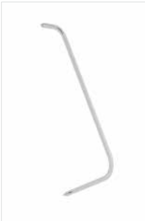
Abb. Bestell-Nr. 50109