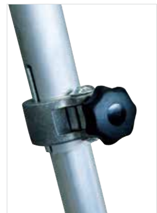
Passend für alle Untergründe durch stufenlos verstellbare Ausleger mit Schnellverschluss