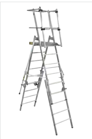
FlexxStep mit Teleskopaufsatz, Bestell-Nr. 52538