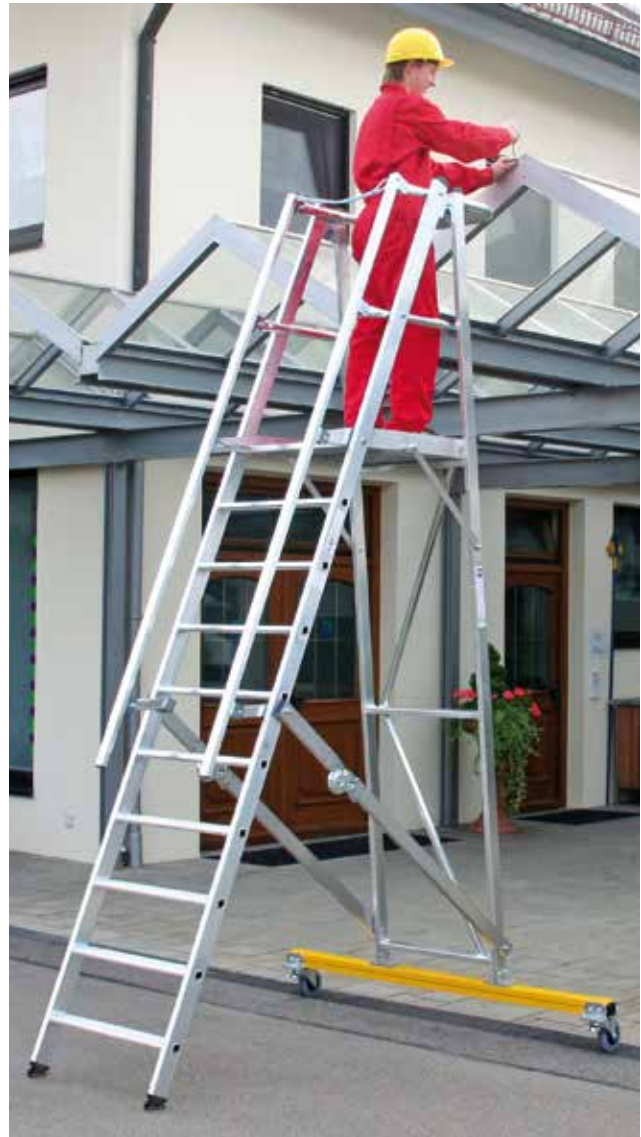
Abb. Bestell-Nr. 52310

Sicherer Stand durch rutschsichere nivello®-Leiterschuhe und Quertraverse mit 2 feststellbaren Bockrollen Ø 125 mm, oben mit großer Ablageschale. Leiterbreite 650 mm.