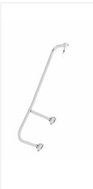
Abb. Bestell-Nr. 50225