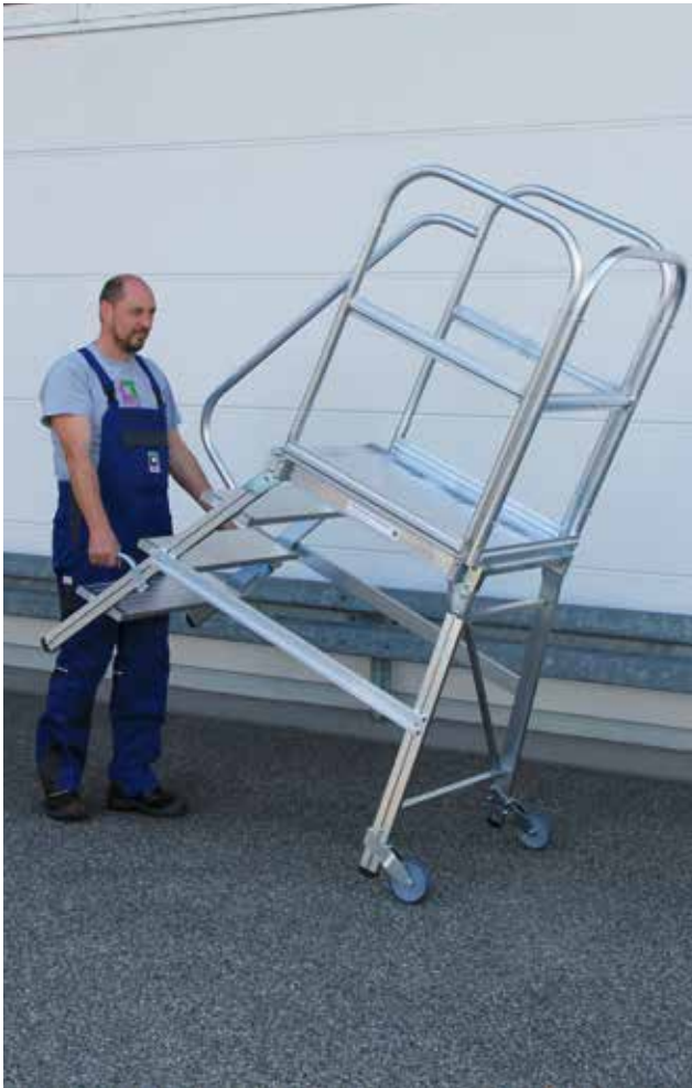
Abb. Bestell-Nr. 56104 mit Handlauf Bestell-Nr. 50109